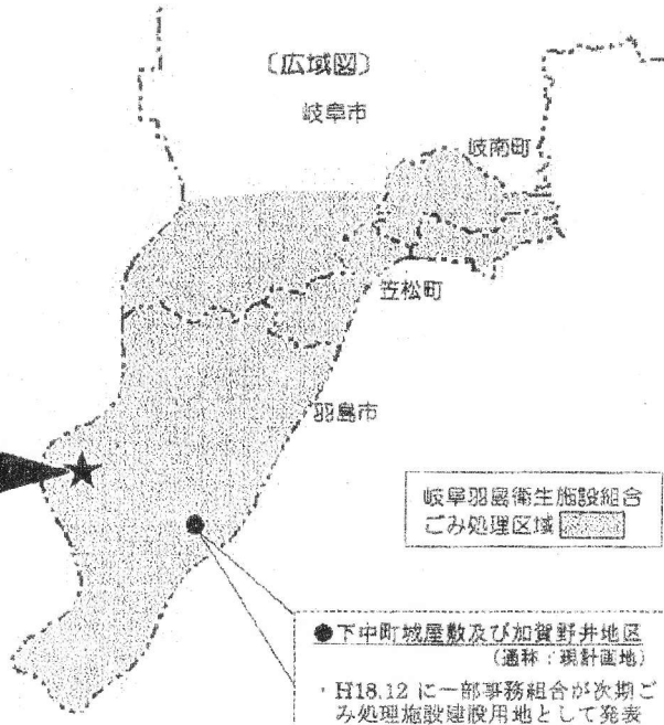
岐阜羽島衛生施設組合 ごみ処理区域